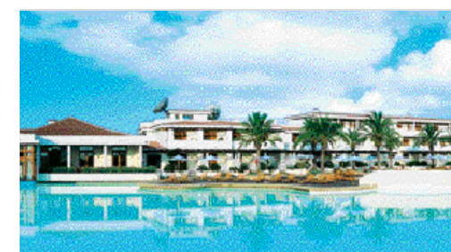
Eden Village gli Argonauti

Le strategie da condividere con le agenzie di viaggi, sono dice Cartelli: «L'azione più efficace è proporre un pricing intelligente senza cedere sulla qualità dei servizi e dare agli adv maggiori strumenti per offrire consulenza e fidelizzare il cliente. In particolare stiamo proponendo un corso di formazione online con temi non solo tecnici, ma anche legati alla formazione manageriale del consulente».