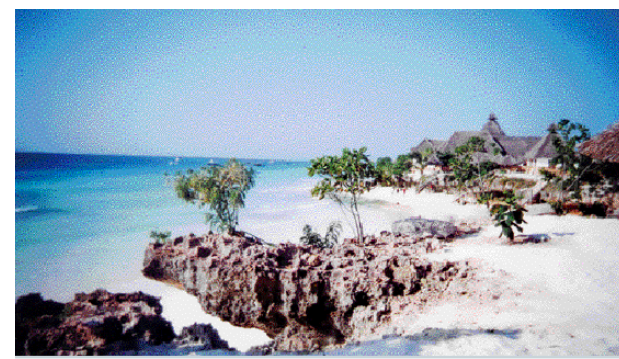
La spiaggia del My Blue

A Uroa invece, in prossimità di Kiwengwa, sulla costa est dell'isola, si affaccia il rinnovato 4 stelle Ora Beach Resort firmato Atlantis Club, il marchio con il quale I Viaggi di Atlantide seleziona le strutture con elevata qualità dei servizi, anche in rapporto al prezzo. Nel giardino tropicale, con vista sulle lingue di sabbia dell'Oceano, le 100 camere e suite (ideali per famiglie, con personale dedicato nella presidenziale ), arredi in stile zanzibarino, ristorante fronte piscina, centro diving e water sport, boutique con sarto, animazione. Il t.o. lo propone a febbraio con un'offerta di 1.290 euro a persona per 9 giorni/7 notti (con promozione Speciale anniversari : supplemento camere De Luxe e Jungle gratis, e sconto 50% sulle suite a chi festeggia compleanno, anniversario o viaggio di nozze). In soft all inclusive anche la proposta dell'Atlantis Club Michamvi a 1.350 euro. Per entrambe le offerte, partenze da Malpensa, Bologna, Verona, Roma.