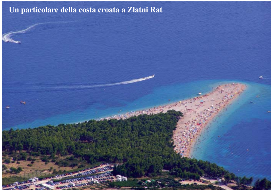
Un particolare della costa croata a Zlatni Rat

a quelli isolate, a riprova del fatto che la ricerca di indipendenza resta condizionata alla propria capacità di spostamento in auto o in moto: la Croazia viene prescelta soprattutto per le sue risorse costiere, grazie alle roccaforti di Pola, Spalato o della regione della Makarska, mentre le isole già appaiono una meta più impegnativa, costringendo a programmare il trasbordo via traghetto e a ridurre un tempo di permanenza già di per sé ai minimi.