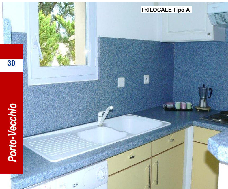
TRILOCALE Tipo A

VILLETTA Confort 4 persone (60 mq ca. + Terrazza): arredate con gusto, ampio soggiorno con angolo cottura attrezzato, frigo congelatore, microonde, caffettiera elettrica, lavatrice, aria condizionata, tv sat, una camera con letto matrimoniale (160 cm), una camera con due letti singoli (unibili), servizi con doccia, asciugacapelli, terrazza attrezzata e barbecue.